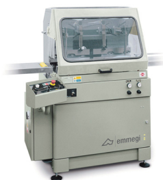
SCIE À ANGLE VARIABLE